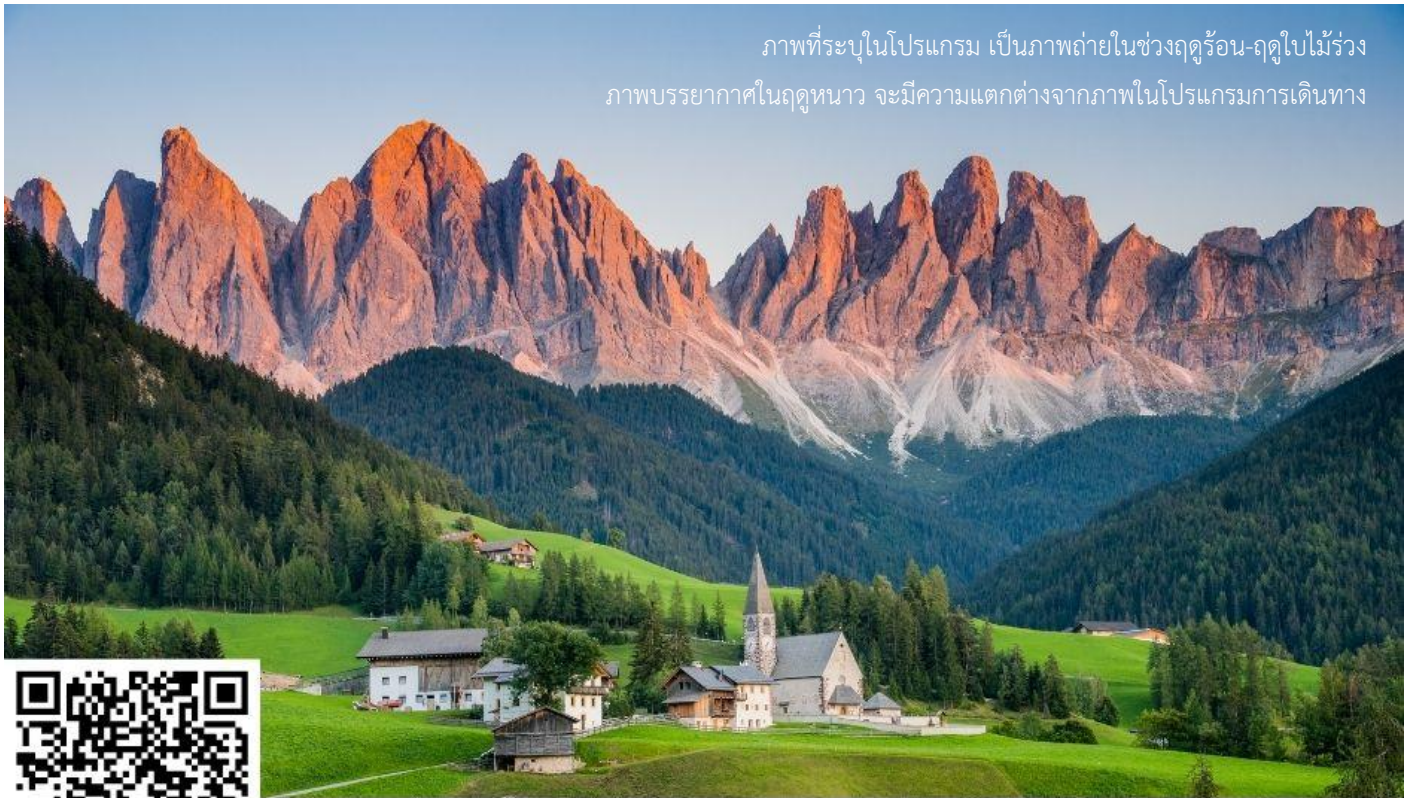
ภาพที่ระบุในโปรแกรม เป็นภาพถ่ายในช่วงฤดูร้อน-ฤดูใบไม้ร่วง ภาพบรรยากาศในฤดูหนาว จะมีความแตกต่างจากภาพในโปรแกรมการเดินทาง

จากนั้นนำท่านเดินทางสู่ ชุมชน Val di Funes ชุมชนเล็กๆ ทางภาคตะวันตกของอุทยานโดโลไมต์ ประกอบด้วยหมู่บ้านเล็กๆ 6 หมู่บ้าน โดยมีชื่อเสียงจากการมีวิวทิวทัศน์ที่สวยงามที่สุดในเขต South Tyrol อีสระให้ท่านเก็บภาพความประทับใจ จากนั้นนำท่านเก็บภาพความประทับใจอีกหนึ่งสถานที่ ณ โบสถ์ Santa Maddalena โบสถ์ที่ถือเป็นสถานที่ไฮไลท์ที่ ถูกถ่ายรูปรูปมากที่สุดในอุทยานโดโลไมต์ มีวิวทิวทัศน์ที่สวยงามมีฉากหลังเป็นเทือกเขา Odles (การเดินทางขึ้นไปเก็บภาพความประทับใจนี้ ท่านจะต้องเดินขึ้นลงเนินไปและกลับประมาณ 2 กิโลเมตร เพื่อไปเก็บภาพ)